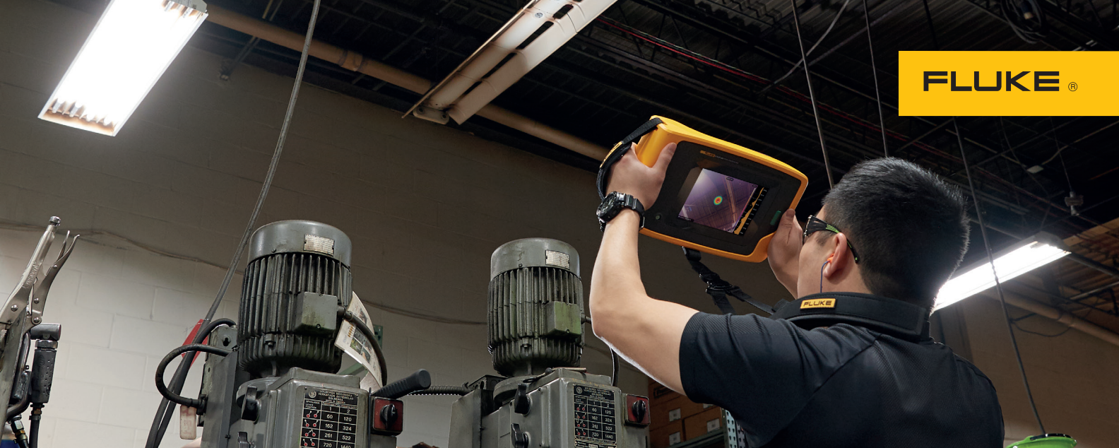
Persluchtleidingen inspecteren met de Fluke ii900 Sonic Industrial Imager