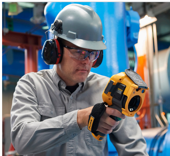
Fluke Ti480 PRO warmtebeeldcamera