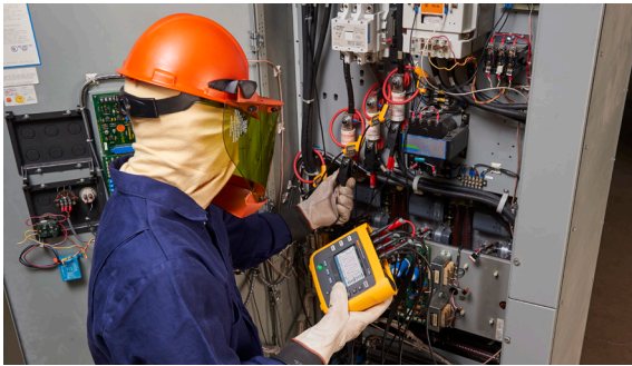
Een Fluke 1738 geavanceerde Power Energy Logger gebruiken om onderzoek te doen naar het energieverbruik van een mechanisch systeem

Beoordeel niet alleen het elektrische toevoersysteem, maar kijk ook naar uw elektromechanische, stoom- en persluchtsystemen. Het gebruik van deze systemen zal over het algemeen meer dan eens gepaard gaan met energieverpilling, maar de oplossing daarvoor is vrij eenvoudig te realiseren.